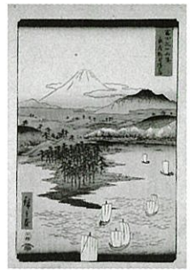
上左: 歌川広重「山海見立相撲 摂津有馬山」当館蔵(前期展示) 上右: 歌川広重「東海道五拾三次 宮」当館蔵(後期展示) 下左: 歌川広重「魚づくし くらだい こだいに山椒」当館蔵(前期展示) 下右: 歌川広重「富士三十六景 武蔵野毛横はま」当館蔵(後期展示)