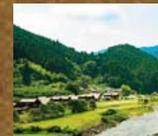
城山砦(しろがね) 前田砦と連繋して中馬街道大馬渡峠を見張る。馬出など技巧的な縄張り特徴が特筆され、武田方による築城もしくは改修の可能性が高い。上矢作町漆原/国道257号城山トンネルの上