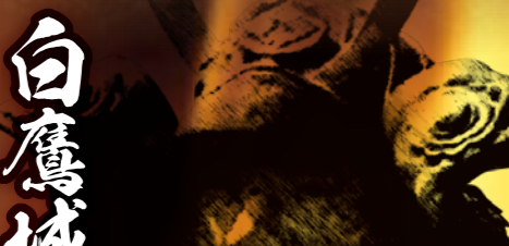
白鷹城(しらゆき) 白鷹城に起つ