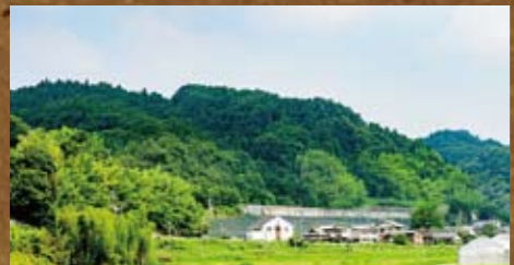
神籠城(鶴ヶ城)(こうのじょう)

勝頼にとって、明知城の戦いは、信玄の後継者にふさわしい武威を世に示すことができた重要な合戦であった。