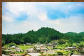
阿木城(あぎじょう)

飯羽間城の北東にある。天正3年の織田信忠による岩村城攻めの際の陣城か。岩村町飯羽間/飯羽間城の北東600m