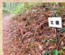
土壘 土を盛って造った防御用の土手。