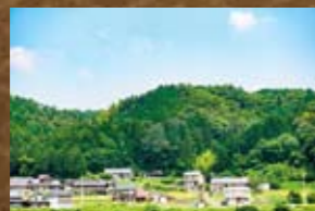
下手向城(しもとうげじょう)

小里氏の居城。天正2年の戦いの後、池田恒興が番手として入った。瑞浪市小里/県道川折交差点南の山