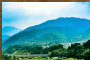
阿寺城(あでらじょう)

岩村と中山道を結ぶ街道を押さえる。円形の大きな主郭が特徴で、岩村城攻防戦の陣城と推定される。中津川市阿木/明知鉄道阿木駅正面の山