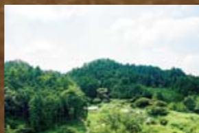
大平城(おおひらじょう)

明智・山岡境の鶴岡連山の北向きの尾根に立地する大規模な山城。小里川流域と屏風山連山を一望できる。山岡町釜屋/釜屋公孫樹会館東900m