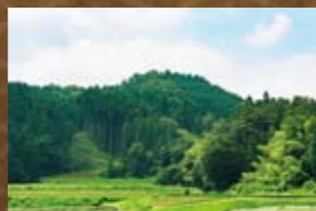
釜屋城(かまやじょう)

土岐坂(小里・神籠に向かう山越えの道)の登り口を見下ろす尾根に立地。主郭を囲む横堀とこれに連動した塀堀が見所。山岡町下手向/鶴岡簡易郵便局の裏山