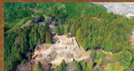
岩村城(いわむらじょう) 遠山氏の本城で東海地方を代表する山城。天正2年には武田二十四将の一人秋山虎繁が入り、対織田最前線の拠点となっていた。岩村町/岩村歴史資料館前の道が登城口