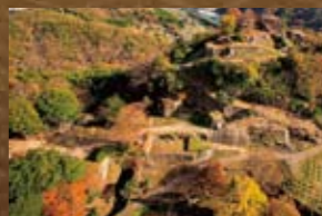
苗木城(なえぎじょう)

中津川と岩村を結ぶ根の上越えの街道を押さえる。天正2年の戦いでは武田方の木曾義昌の攻撃を受け、飯羽間の遠山友重が討死している。中津川市手賀野/手賀野配水池東側の尾根の上