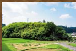
飯羽間城(いしばまじょう)

遠山一族の中で三遠山に次いで有力な串原氏の居城。天正2年の戦いで明知城とともに武田方の攻撃目標となり落城した。串原/市自主運行バス大平バス停前の山