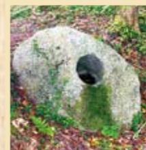
柱石 陣旗を立てる基礎(旗竿石)か、茶室に付属する手水鉢か、諸説あり。

斜面に対して横方向(等高線に平行)に設けられた堀。明知城の横堀は主要な三つの曲輪を大きく囲み、堅堀と組み合わせているのが特徴。