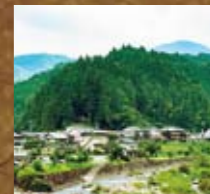
前田砦(ぜんだとりで) 岩村城と武田領国を結ぶ中馬街道上村宿を押さえる要衝。東美濃最大級の巨大な堀切を有する。上矢作町本郷/JA上村支店横・大船神社参道入口が登城口