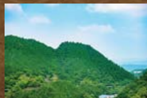
小里城(おりじょう)

延友氏の居城。織田方による岩村城攻略の拠点で、天正2年の戦いで信長が本陣とし、続いて河尻秀隆が定番となり常駐した。瑞浪市土岐町鶴城/国道19号鶴城交差点西南の山