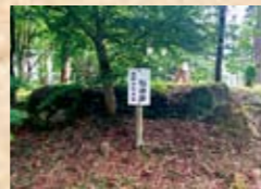
巨石列 出丸の入口は巨石列によって仕切られており、ここが特別な場所であったことを示唆している。