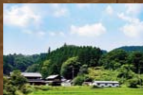
信の城(のぶのしろ)

室町幕府奉公衆の系譜を引く遠山飯羽間氏の居城。岩村町飯羽間/飯羽間から山岡町久保原へ向かう県道沿い