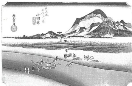
歌川広重「東海道五拾三次之内 小田原 酒匂川」