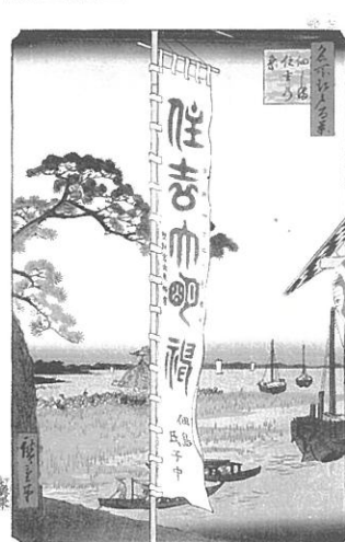
歌川広重「名所江戸百景 佃しま住吉の祭」