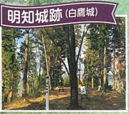
標高530mの山に築かれた天険の地形を巧みに利用した山城。遺山十八城の一つ。地元専任ガイドが案内します。