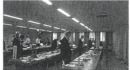
< 審査風景 >