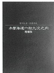
↑左：図録『歌川広重・溪斎英泉 木曾海道六拾九次之内 増補版』2,500円

ミュージアムショップでは、当館の代表的なコレクションである「木曾海道六拾九次之内」をご自宅でも楽しめるさまざまなグッズを取り揃えています。オリジナルとほぼ同じサイズの全71図を揃えた版画シートセット、同じく全図を収めた絵はがきセットをはじめ、図録『歌川広重・溪斎英泉 木曾海道六拾九次之内 増補版』、広重と同じ歌川派の絵師たちが描いた、木曾街道をテーマにした作品を同時に楽しめる図録『浮世絵 木曾街道三種揃踏』など、浮世絵で木曾街道(中山道)の魅力を楽しめる商品がたくさんあります。ぜひミュージアムショップにお立ち寄りください。