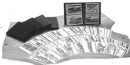
※絵はがきは1枚からでもお求めいただけます。