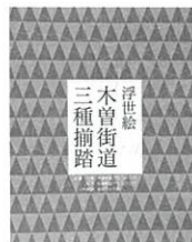
右：図録『浮世絵 木曾街道三種揃踏』2,800円