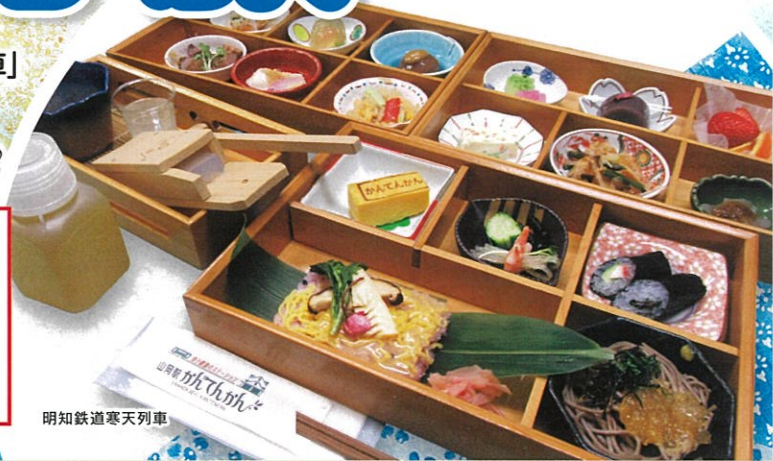
明知鉄道寒天列車

魅力が増した恵那峡散策と、人気の明知鉄道「グルメ列車」での昼食をメインにしたコースです。 恵那の魅力をギュッと詰め込んだおすすめのコースです。