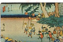
歌川広重《東海道》(隷書版)「世五 五十三次 吉田」