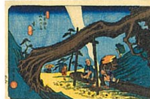
歌川広重《木曾海道六拾九次之内》「本山」

まずは、広重描くユニークなキャラクターたちをご紹介します！一見何気なく描かれているように見える人物たちですが、彼らをよく観察すると、喜怒哀楽や些細なしぐさなどがしっかりと描き分けられていることに気が付きます。皆さんも、ぜひお気に入りの「推しおじ」を見つけてみてください！