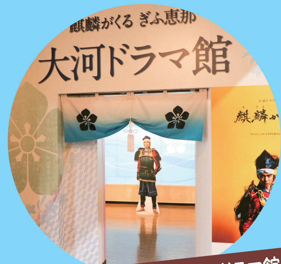
麒麟がくる ぎふ恵那 大河ドラマ館