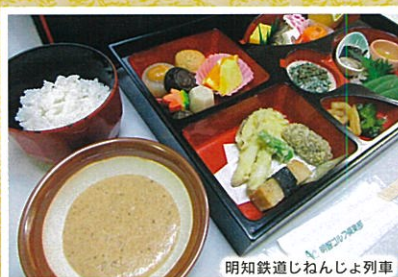
明知鉄道じねんじょ列車

明智光秀公ゆかりの地である明智町の散策と、人気の明知鉄道「じねんじょ列車」での昼食をメインにしたコースです。恵那の魅力をギュッと詰め込んだおすすめのコースです！