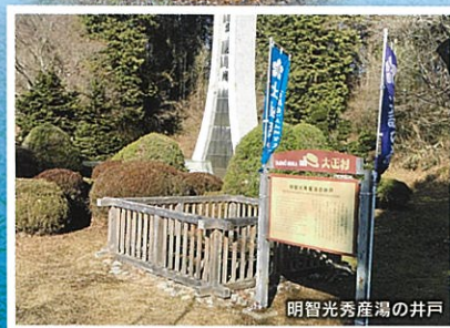
明智光秀産湯の井戸