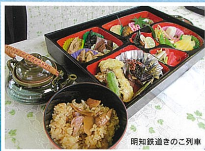
明知鉄道きのこ列車