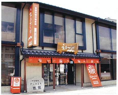
「JR」、「明知鉄道」恵那駅ヨコ