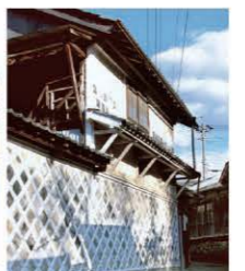
日本大正村 ここ日本大正村は造られたテーマパークではなく、大正時代の「旧き良き」建物や人情をそのまま残し、訪れる人を温かく迎える空間となっています。