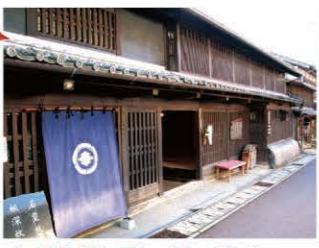
岩村城下の町並み 明知鉄道岩村駅から城跡方面に延びる本通りは、往時の面影を色濃く残す商家の町並みとして、国の「重要伝統的建造物群保存地区」に選定されています。