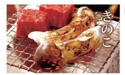
きのこと 香り豊かな松茸とびきり素晴らしい松茸をはじめ、山でとれたばかりの新鮮なきのこが様々な調理法で楽しめます。