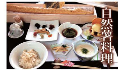
自然薯料理 独特の粘りと土の風味が特徴の山芋。滋養強壮に良い山里の高級珍味です。