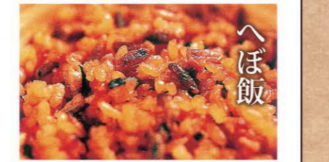
へぼ飯 地蜂の幼虫を甘辛く煮込んだ保存食。動物性たんぱく質がたっぷりです。