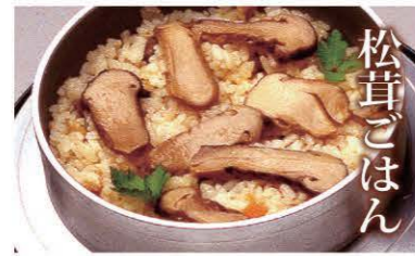
松茸ごはん 香り豊かな松茸と一緒に炊き上げたご飯。秋の味覚として地元の料理店で味わえます。