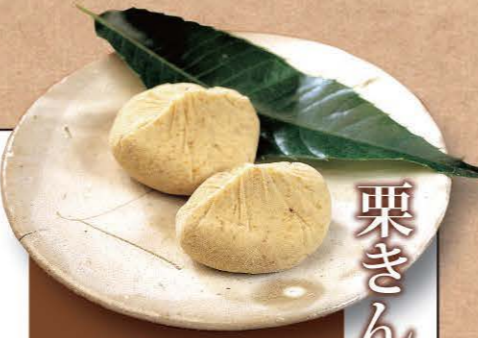
栗きんとん 火を通した栗をひとつひとつ手でくりぬき、砂糖と合わせてじっくり炊き上げ、また一つずつ手しぼり。二つと同じ形がない手づくりの栗菓子です。