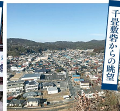
千畳敷砦からの眺望