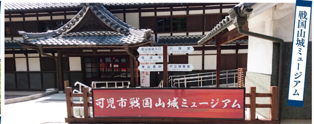
戦国山城ミュージアム